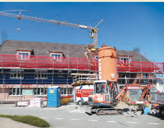
Schulhausstrasse